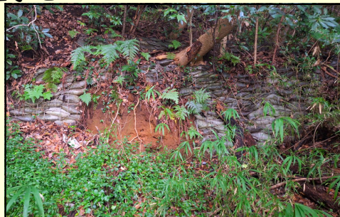
軍による地下壕跡(岡田)

町内には今でも戦争当時の頃の記憶を持った方々が多くおられます。また戦時中に亡くなられた方々の慰霊碑だけでなく、相模海軍工廠に由来する戦争遺跡なども町内には残っています。戦争の歴史を継承し平和思想を広めるためにも、当時を生きてきた語り部の方による講演会などを積極的に行うことや、戦争を伝える遺跡などをまとめて紹介していくこと、そして小・中学校における教育にも活かしていくことを訴えました。