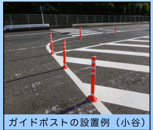
ガイドポストの設置例（小谷）

圏央道の開通などもあり、近年、町内の交通量は増加傾向 にあります。それに伴い、生活道路である町道が抜け道とし て使われている状況も多々見受けられます。そのような中で 安全な道路の整備のためにも、まずは定期的な交通量の調査 を行うべきではないかと訴えました。町からは『大規模な施設や企業が出来る場合や新設道 路が供用される場合には開発事業者側によって交通量調査を実施しているので、町としては 町内全域の定期的な調査は必要ないと考えている』とのことでしたが、同時に『交通の流れ に大きな変化があった場合においては、安全対策立案のために実施の必要もあると考えてい る』との回答がありました。